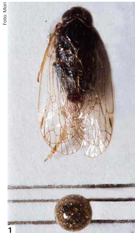
Foto 1 - Adulto di Hyalestes obsoletus Foto 2 - Adulto di Scaphoideus titanus su trappola cromotropica. Foto 3 - Stadi giovanili (I, II, III) di Scaphoideus titanus

La specie è stata ritrovata negli anni 80 in provincia di Vicenza e subito associata alla diffusione della flavescenza dorata (Belli et al. , 1984). Una quantificazione delle popolazioni è stata riportata in Rui et al. nel 1987.