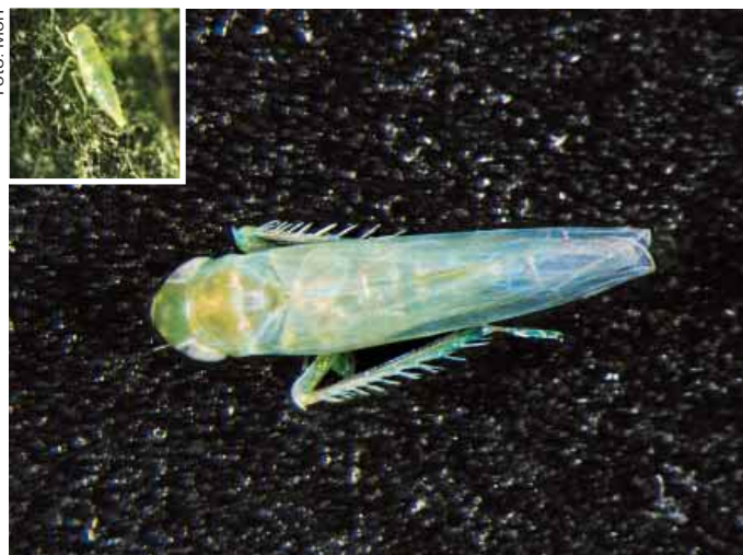
Foto 4 - Adulto di Empoasca vitis e nel riquadro un giovane

I vigneti oggetto di studio sono situati sia in areali dove i gialli sono presenti da anni, sia in zone non ancora colpite. Le indagini sono state compiute in collaborazione con i tecnici vitivinicoli operanti nel territorio veneto.